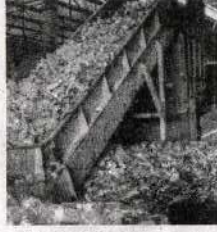
आर्थिक नुकसान का सामना कर रहे हैं।

बढ़ती कीमतों के कारण प्लास्टिक उत्पाद बनाने वाली सूक्ष्म, लघु और मध्यम इकाइयों (MSMEs) के लिए अतिरिक्त पूंजी निवेश करना बेहद मुश्किल हो गया है। कच्चे माल की कीमतों में हुई असहनीय वृद्धि के कारण ये इकाइयां इस समय बंदी की कगार पर पहुंच गई हैं। प्लास्टिक के दाने खरीदने के लिए अब पहले की तुलना में 50 से 70 प्रतिशत अधिक धनराशि की आवश्यकता पड़ रही है। इतना बड़ा निवेश करना छोटे उद्योगपतियों के लिए असंभव होने के कारण कई इकाइयों में उत्पादन प्रक्रिया पूरी तरह ठप हो गई है और वे भारी